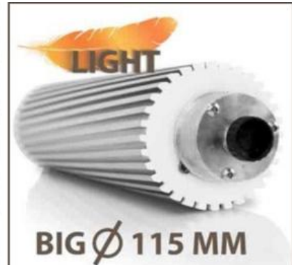
Rouleaux robustes en acier inoxydable