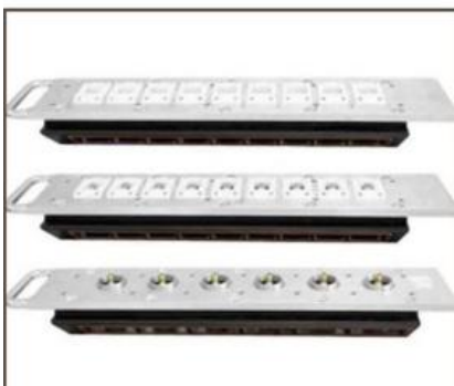
Règles de dosage de haute qualité