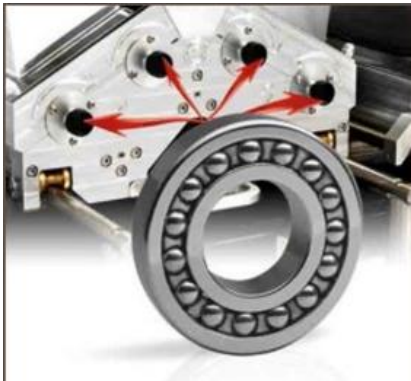
Roulements à billes